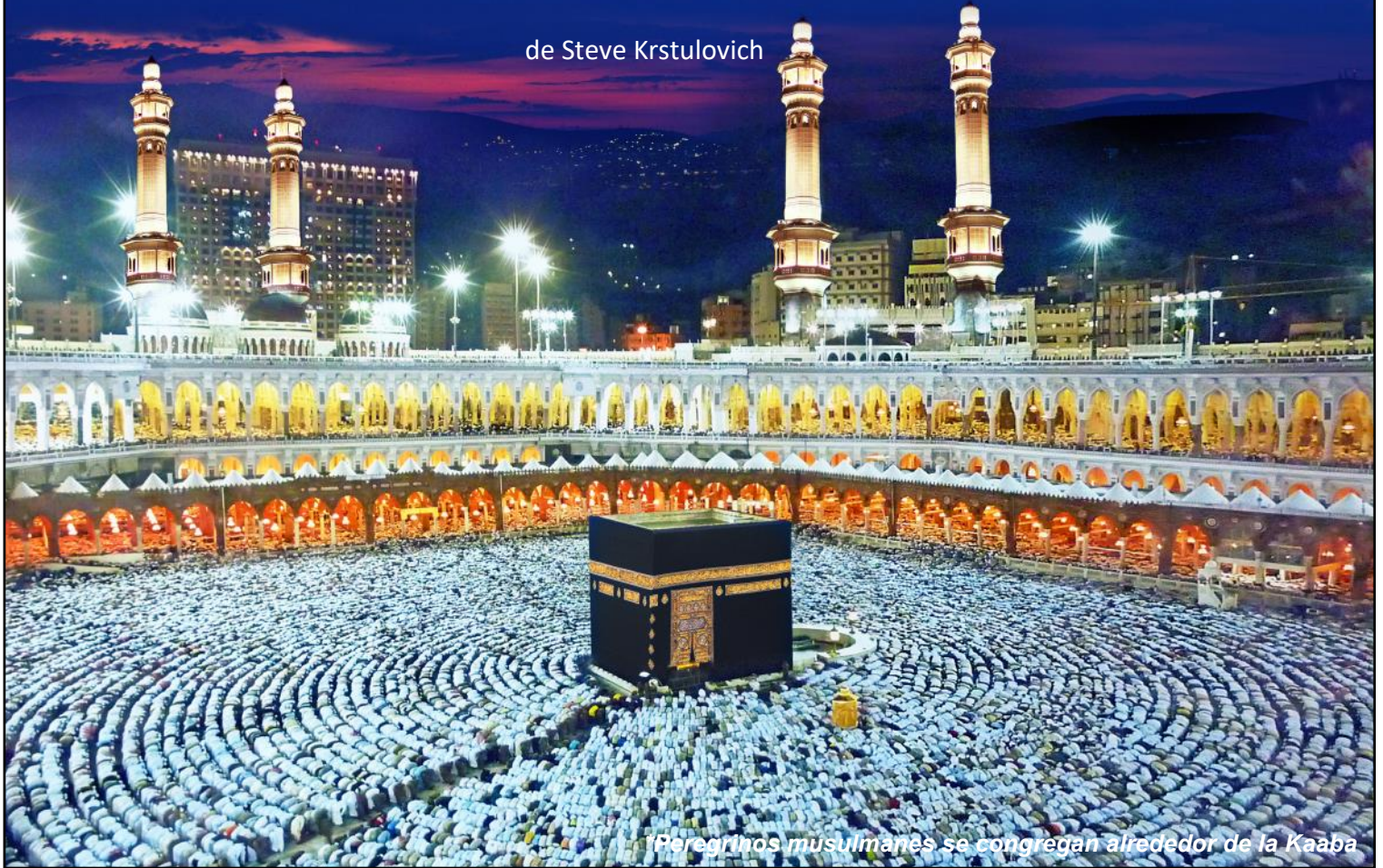
Peregrinos musulmanes se congregan alrededor de la Kaaba

Del 16 al 18 de junio, millones de musulmanes de todo el mundo llegarán a La Meca, Arabia Saudita, para la peregrinación islámica ( Hajj ). Los musulmanes adultos deben realizar el Hajj al menos una vez en su vida si es posible, para ganar méritos espirituales, borrar los pecados del pasado y comenzar de nuevo. En otras fechas, muchos musulmanes realizan otras peregrinaciones voluntarias a La Meca, conocidas como Umrah . El Hajj es la mayor fuente de ingresos de Arabia Saudita, ¡después de la venta de petróleo y gas!