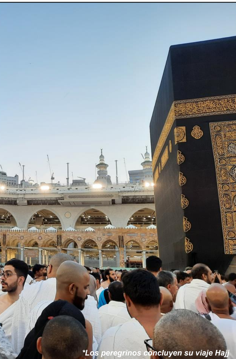
*Los peregrinos concluyen su viaje Hajj

mientras que la Biblia nos dice cinco veces en Génesis 22 que fue Isaac. 4 Incluso el famoso erudito musulmán Al-Tabari admitió que “los primeros sabios de la nación de nuestro profeta no están de acuerdo sobre cuál de los dos hijos se le ordenó sacrificar a Abraham. Algunos dicen que fue Isaac, mientras otros dicen que fue Ismael.” 5