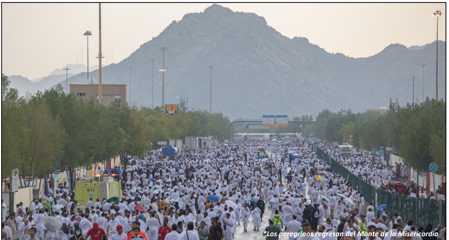
*Los peregrinos regresan del Monte de la Misericordia

Al leer esta edición sobre la celebración islámica del sacrificio, es nuestro deseo que recibas la carga de orar por los 2 mil millones de personas que nunca han conocido a Jesucristo como el Cordero que fue inmolado por ellos desde la fundación del mundo. ¡Qué el Espíritu nos use para alcanzarlos!